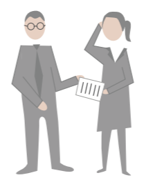
Berater / Sonstige

Als externer Erwerber haben Sie bisher wenig Einblick in das Unternehmen, und kennen weder die operativen Geschäftsprozesse noch die Unternehmenskultur. Möglicherweise müssen Sie daher wesentliche Aspekte der Unternehmensbewertung, wie die zukünftigen Jahresgewinne, schätzen, da Ihnen valide Informationen nicht vorliegen. Der KMUrechner zeigt Ihnen daher auf, welche Themen für die Unternehmenszukunft von Relevanz sind und wo Sie noch tiefer nachfragen müssen.